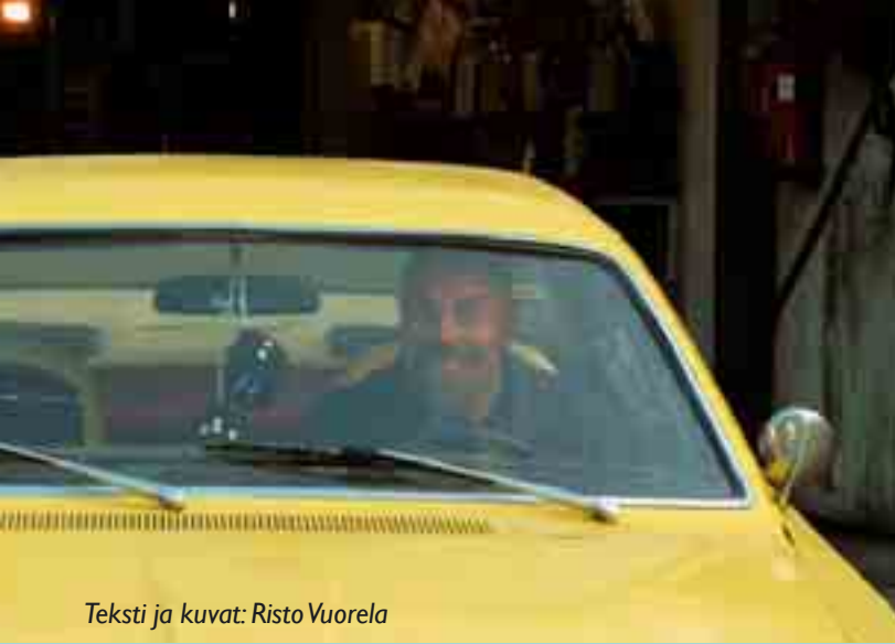
Teksti ja kuvat: Risto Vuorela