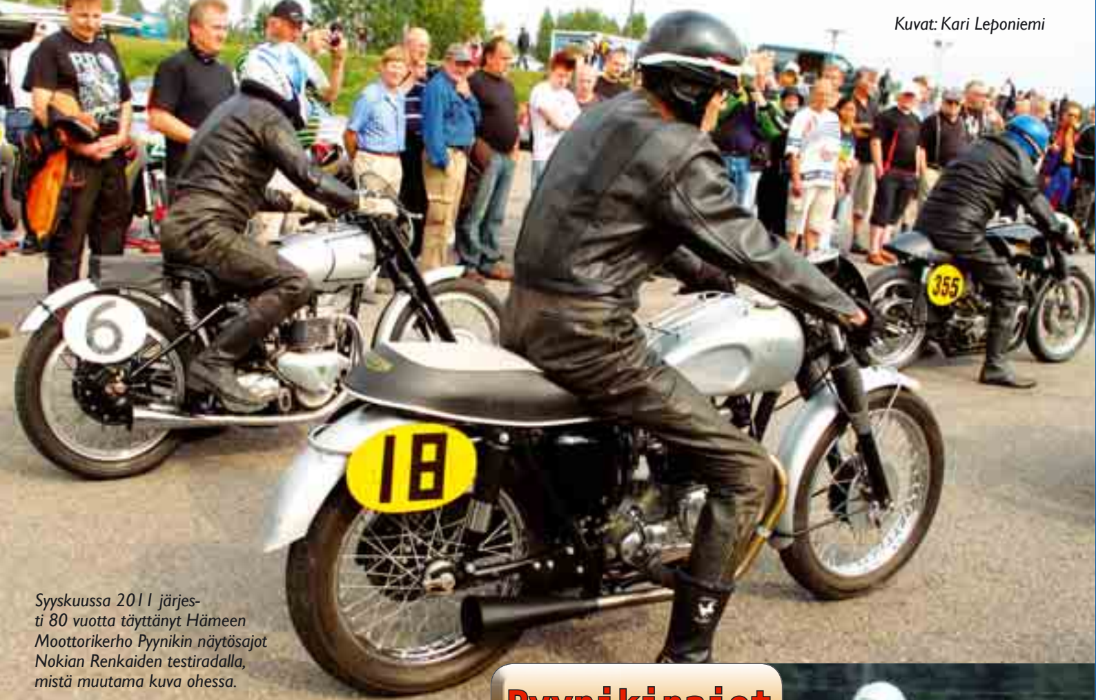
Syyskuussa 2011 järjesti 80 vuotta täyttänyt Hämeen Moottorikerho Pyynikin näytösajot Nokian Renkaiden testiradalla, mistä muutama kuva ohessa.