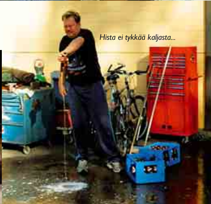
Hista ei tykkää kaljasta...