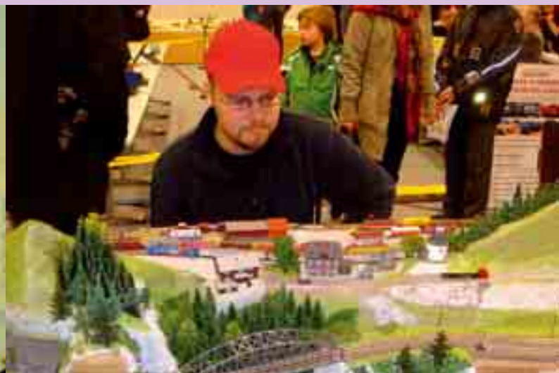
Pienoismallipäivä oli paljon aikaisempaa enemmän. Niitä oli isossa ja pienessä mittakaavassa. Tämä rata, ilmeisesti pienoismalli jostain sveitsiläisestä rautatiestä, oli katsojien mielestä poikkeuksellisen kiinnostava ja pääsi Aamulehden kuvaankin.