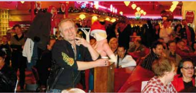
Tilaisuudessa oli hyvä fiilis, minkä Hatkan ilme vääjäämättä todistaa!