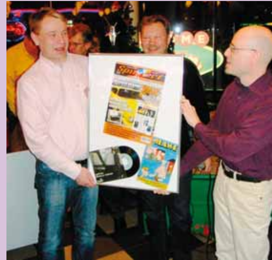
Kaupallisista yhteistyökumppaneista Spinneri toi itsestään muistuttavan lahjan.