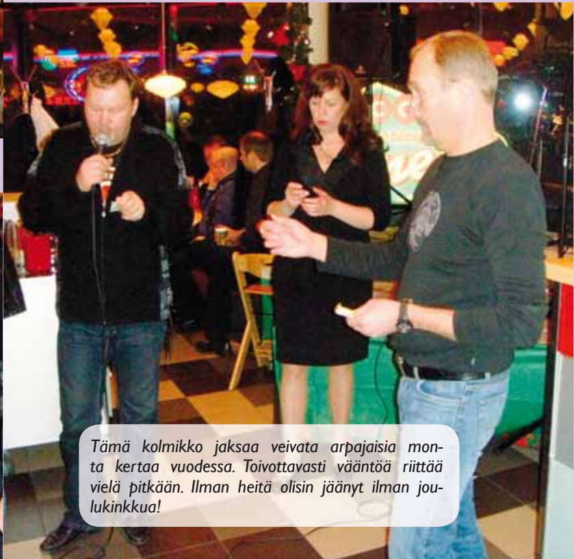
Tämä kolmikko jaksaa veivata arpajaisia monta kertaa vuodessa. Toivottavasti vääntöä riittää vielä pitkään. Ilman heitä olisin jäänyt ilman joulukinkkua!